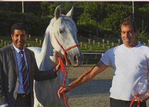
Berberstute Mirza