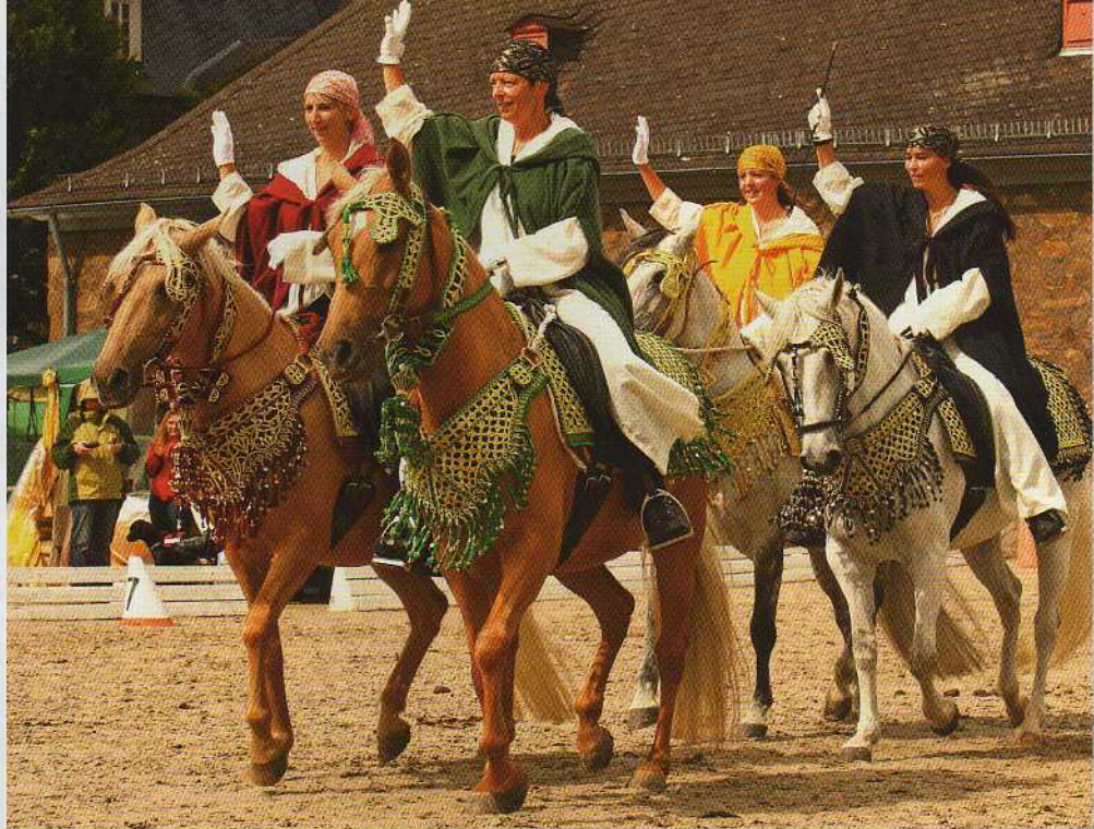
Quadrille des Schweizer Verband Berberpferde, Foto: Katja Gretscher-Said