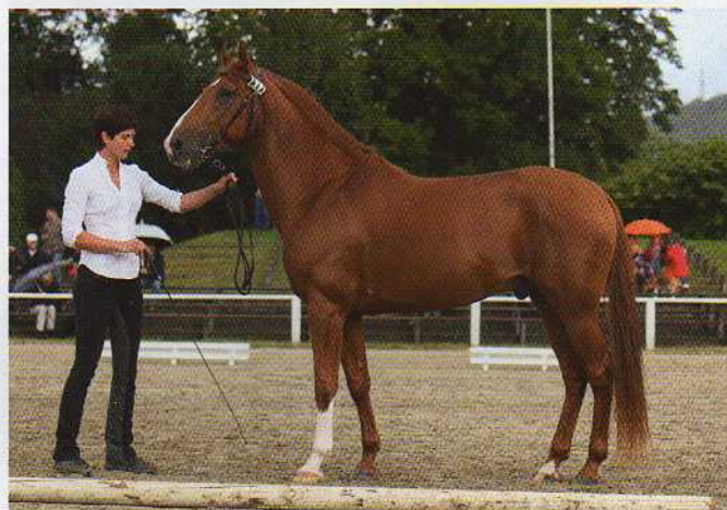
Araber-Berberhengst Rifaj Arj et Fouad, Foto: Jeanette Neumann

Die Zuschauer ließen sich durch das durchweg schlechte Wetter an diesem Wochenende nicht verdrießen und sorgten für gute Stimmung. Es war ein Berbertreffen mit internationalem Flair, wo Gäste und Besucher sich mit dem Fachpublikum austauschen konnten. Verkaufsstände und marokkanische Spezialitäten trugen zum Gelingen des Festes bei.