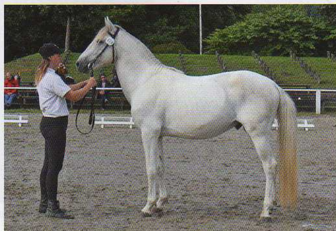
Berberhengst Sigfried des Balmes