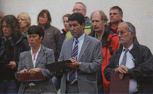
Richterkommission Deutschland, Marokko und Frankreich